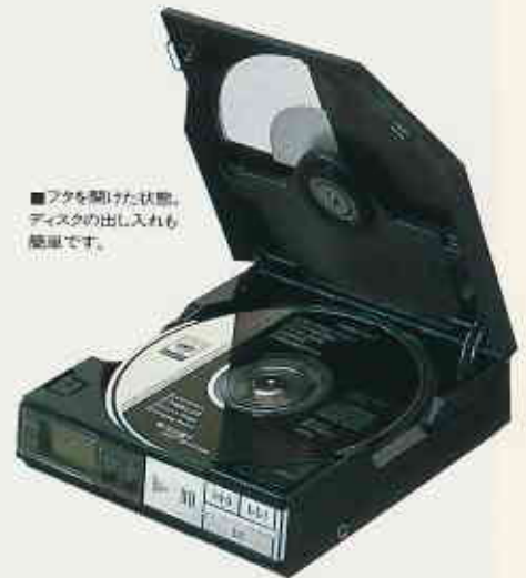
■フタを開けた状態。ディスクの出し入れも簡単です。